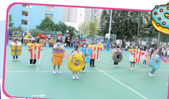
可愛的創意舞蹈小組為巡遊壓軸表演。