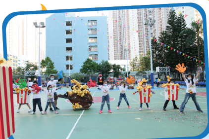
美味香甜的爆谷化身為音色悅耳 的大提琴，想必在弦線的震動下， 科小能譜出「奔向未來」的樂章！