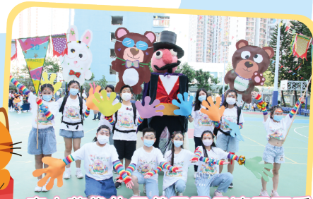
高大英俊的馬戲團團長連同可愛 小動物駕臨「科小生日派對」。