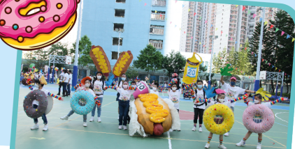
吃一口皮脆肉香，醬汁滿滿的熱狗， 快樂和滿足湧上心頭！