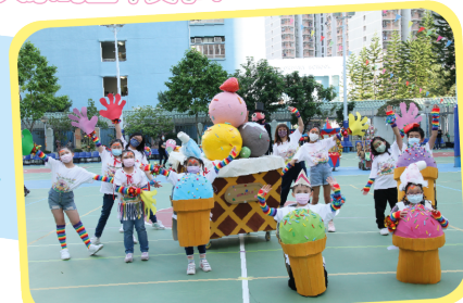
「叮！叮！叮！」雪糕車來了，在炎炎夏日 來個三色雪糕球，世界就是如此美好！