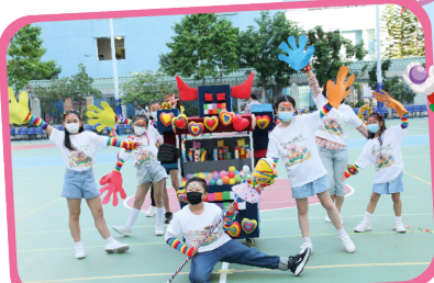
這個充滿「愛心」的機械人， 就如科小一樣散發關愛能力！