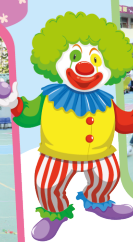
小丑先生總有無數方法讓笑聲響 遍整個校園。