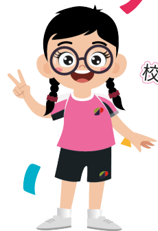
校長為我們的藝術巡遊揭開序幕。