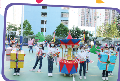
我們希望透過旋轉木馬， 一同感受大家的童年美事！