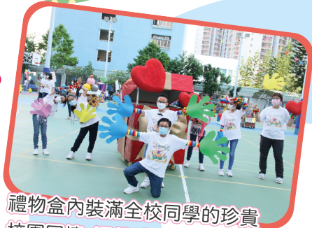
禮物盒內裝滿全校同學的珍貴 校園回憶，這份禮物絕對是無 價的！