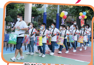
聲勢浩大的水桶敲擊樂隊為巡遊助興。 每一個水桶都是同學們的傑作。