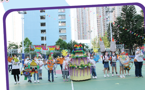
生日蛋糕融入了「綠色校園」元素，慶 祝生日亦不忘支持環保生活！